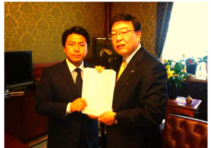
衆議院事務総長へ法案提出

働き方改革やIR法案、TPP、参議院定数6増案など多くの法案で誤魔化し答弁が続き、本質的な議論が出来ずに強行採決されました。働き方改革は、法案作成の前提になった政府の労働時間実態調査がデタラメだったことが発覚し、謝罪撤回しました。IR法案では、複合施設と言いながらその収益の8割をカジノで見込んでおり、その対象の多くは外国人ではなく日本人であることが事実となり、カジノ業者(外国の企業が有力)がお客に対し、貸金業務を行えることも指摘されています。世界でもカジノを作れば儲かる状況とは言えず、むしろ治安対策や犯罪対策、ギャンブル依存症対策など総合的に考えなくてはならず、カジノで経済成長との倫理的な問題、カジノ(ギャンブル)を合法化することへの懸念もあり、まだまだ議論の必要があります。