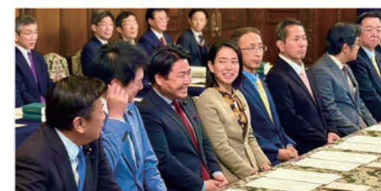
議院運営委員会にて