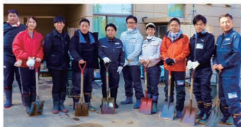
党青年局長として仲間と能登へ

補正予算まで約1年かかりましたが、やっと補正予算が成立し、与党案を立憲民主党から交渉し、能登の震災復興予算に1000億超を増額する修正を実現しました。与党提出の予算案が修正されるのは28年ぶりで、補正予算の審議では、憲政史上初めてのことです。