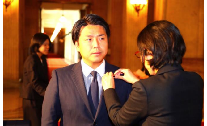
議員バッジを胸に