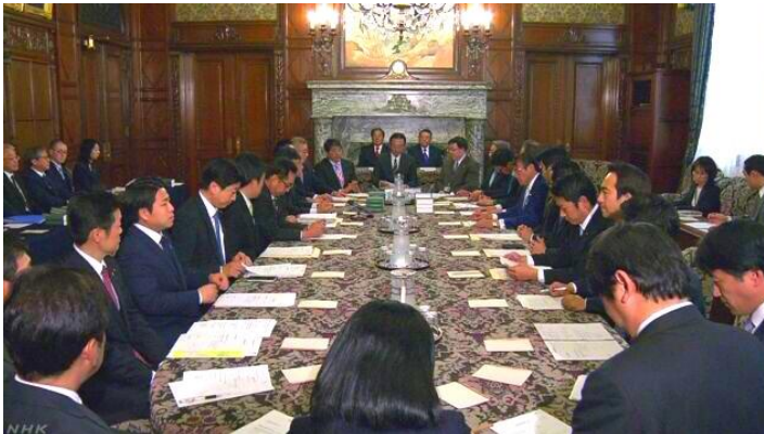
議院運営委員会(写真1)